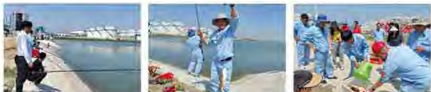
(图为钓鱼比赛精彩瞬间)

此次钓鱼比赛活动，为员工提供了一个展示风采、切磋技艺的平台，让大家在繁忙的工作之余放松了心情、陶冶了情操，展示了俊源员工热爱生活、积极进取的精神风貌。大家纷纷表示，将把比赛时的专注与激情带入到工作岗位，以更饱满的精神状态，为公司发展壮大做出更大贡献。